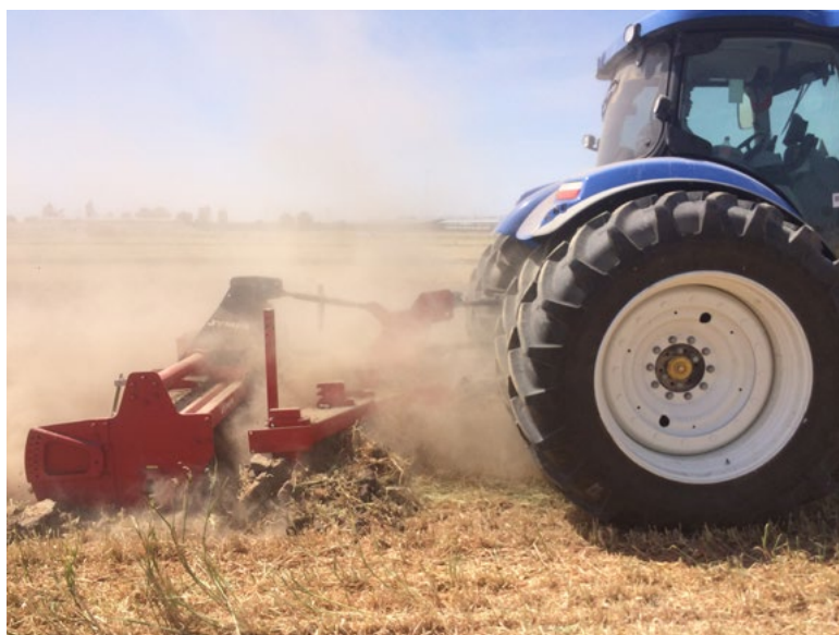
Model DUPLA-2500-S s tyčovým válcem Ø 410 mm