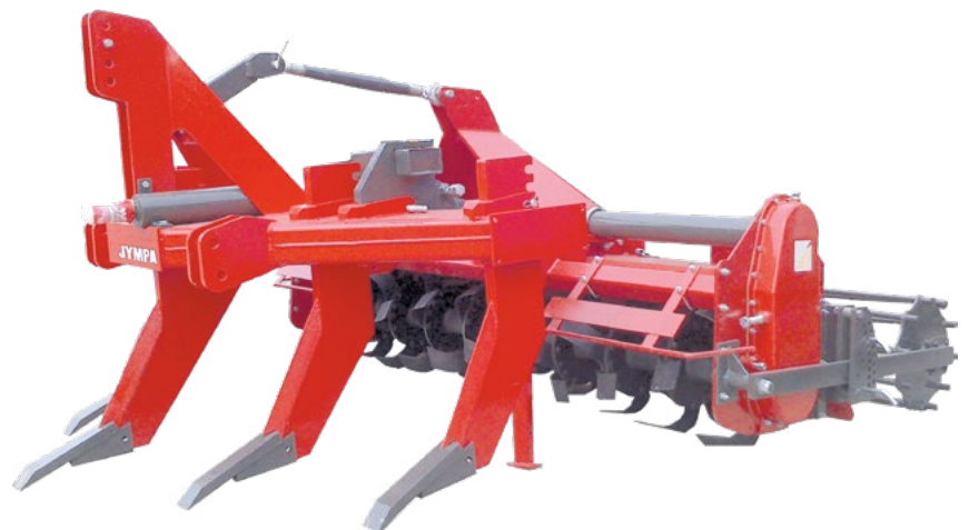
Model DUPLA-2500-S s tyčovým válcem Ø 410 mm