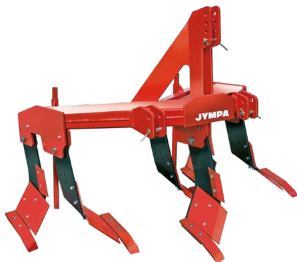
Model MINTAKA-3 s ochranou ramen