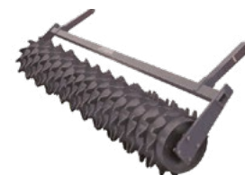
Pěchovací válec Ø 430 mm